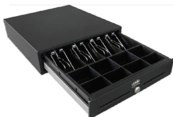
Kassalåda i plåt (4 Sedelfack)