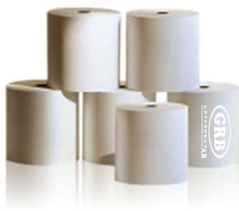
Thermo rullar 57X50