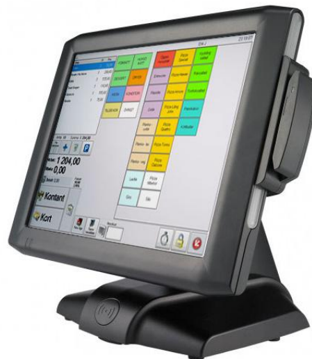
FEC Gladius Smart